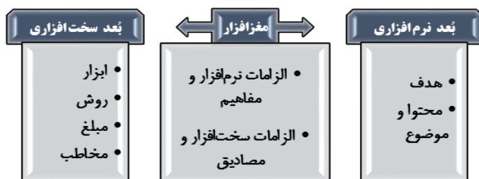
شکل ۱: ارکان و اجزای نظام تبلیغ فرهنگی